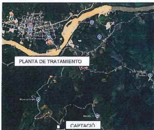
Figura 1. Ubicación del terreno a expropiar.

quince (915), de fecha catorce de junio del dos mil veintidós. Lote signado con el Nro. 37, que tiene los siguientes linderos y dimensiones. POR EL NORTE: Con el Lote N° 36-G, en 48.68 metros, rumbo S75^{\circ}20'43''E , en 116.04 metros, rumbo S42^{\circ}54'17''E , en 48.26 metros, rumbo S84^{\circ}03'11''E , en 57.71 metros, rumbo S62^{\circ}06'09''E , con el Lote N° 36-F, en 129.56 metros, rumbo S47^{\circ}48'56''E , en 50.96 metros, rumbo S74^{\circ}03'16''E , en 59.08 metros, rumbo S87^{\circ}05'20''E . POR EL SUR: Con Santos Jiménez, en 223.44 metros, rumbo S86^{\circ}24'27''W , en 10.20 metros, rumbo S11^{\circ}18'35''E , con quebrada S/N, en 284.34 metros, rumbo variable. POR EL ESTE: Con terrenos de Sergio González, en 20.25 metros, rumbo S69^{\circ}46'30''E , en 81.86 metros, rumbo S25^{\circ}18'46''E , en 29.86 metros, rumbo S32^{\circ}37'09''E ; y, POR EL OESTE: Con quebrada Centza, en 330.68 metros, rumbo variable, con vía pública, en 41.76 metros, rumbo variable. Con una cabida de 11.4442 hectáreas.